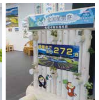
市役所1階展示コーナー

問合せ 林業振興課 全国植樹祭推進室 TEL69-2199 FAX63-4592