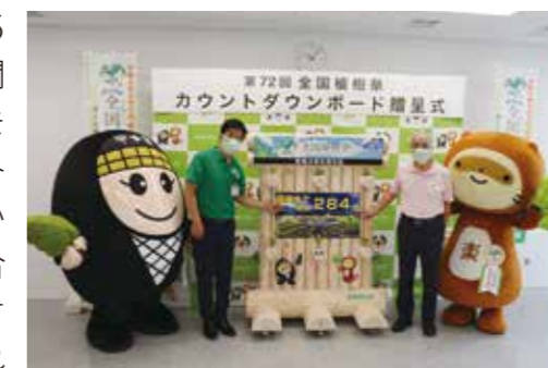
寄贈いただいた カウントダウンボード

第72回全国植樹祭が令和4年6月5日(日)に鹿深夢の森を主会場として開催されるにあたり、開催までの日数を市民や来庁者の皆様にPRするカウントダウンボードを滋賀中央森林組合様から寄贈いただきました。これは同組合が市内で間伐したヒノキを丸太加工されたものです。市役所一階に設置されたカウントダウンボードは開催日までのカウントダウンを始めました。