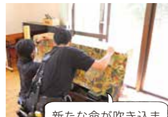
新たな命が吹き込まれていくピアノ

※ストリートピアノとは公共の場所などに設置され、誰でも自由に弾ける状態のピアノです。