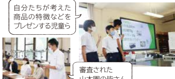
審査された山本園の皆さん