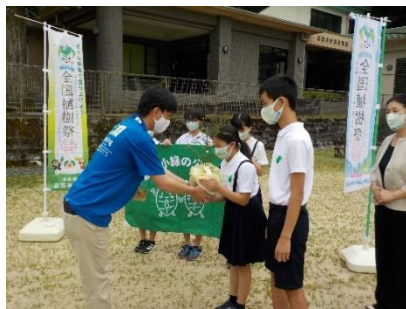
朝宮小緑の少年団