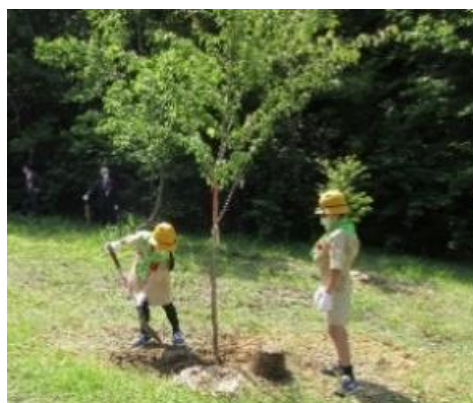
緑のしずく祭（植樹）