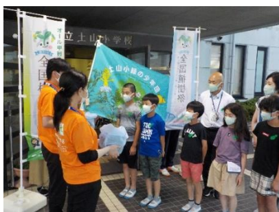
土山小緑の少年団