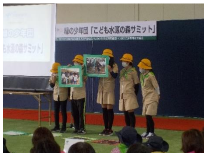
活動発表（大原緑の少年団）