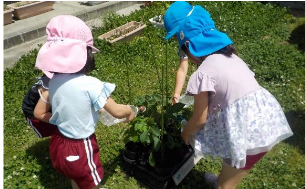
出張相談（大野保育園）