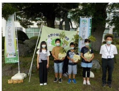
大野小緑の少年団