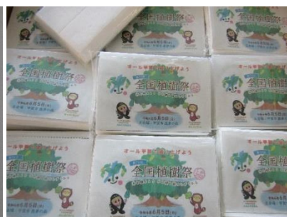
ポケットティッシュ