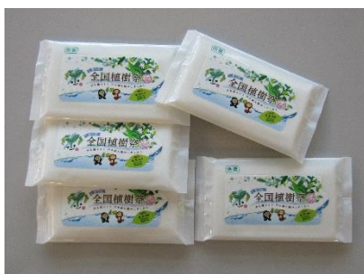
ウェットティッシュ