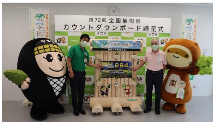
カウントダウンボード贈呈式