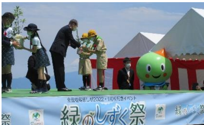
緑のしずく祭（苗木の受け渡し）