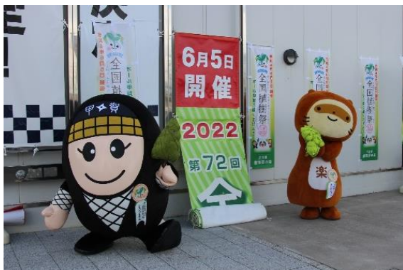
開催日決定をPRするPR大使

8月6日に開催された国土緑化推進機構理事会にて第72回全国植樹祭の開催日が令和4年6月5日(日)に決定したことを受け、鹿深夢の森の看板、のぼり旗、懸垂幕、横断幕などを修正更新