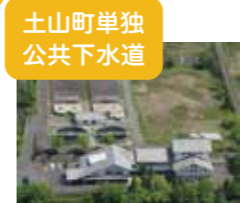
土山町単独公共下水道