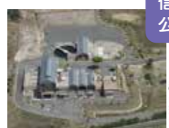
信楽町単独公共下水道

湖南中部浄化センター、土山オーデュープールで処理された水は琵琶湖へ、信楽水再生センターで処理された水は琵琶湖に流れずに海へ流れ着きます。