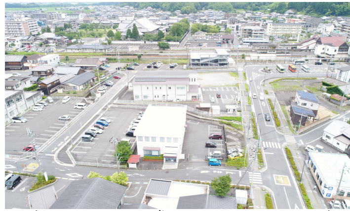
↓マスタープランに基づく模型ができました!↓

○詳細な計画は今後決まった民間事業者とともに作るの で、あくまでも案ということで、一部内容が変わっていく 可能性があります。