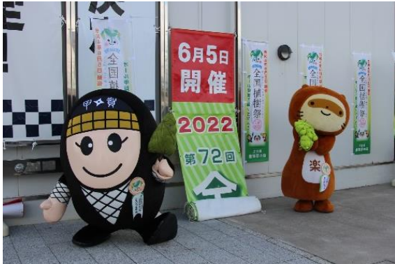
開催日決定をPRするPR大使

8月6日に開催された国土緑化推進機構理事会にて第72回全国植樹祭の開催日が令和4年6月5日（日）に決定したことを受け、鹿深夢の森の看板、のぼり旗、懸垂幕、横断幕などを修正更新