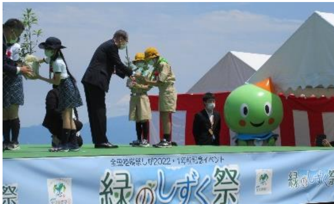
緑のしずく祭（苗木の受け渡し）