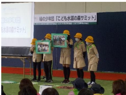
活動発表(大原緑の少年団)