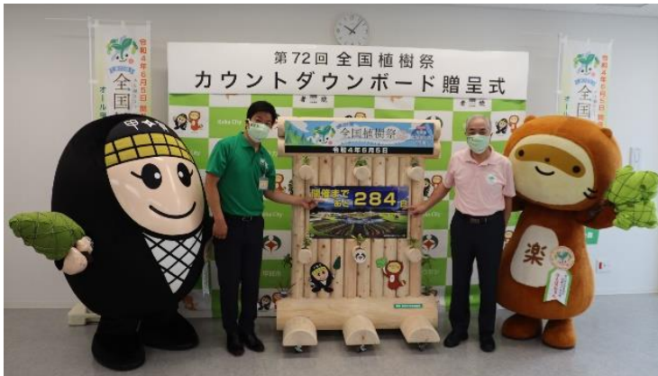
カウントダウンボード贈呈式