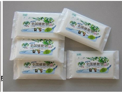
ウェットティッシュ