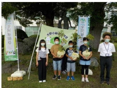
大野小緑の少年団