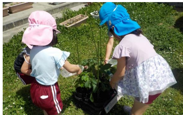
出張相談（大野保育園）