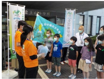
土山小緑の少年団