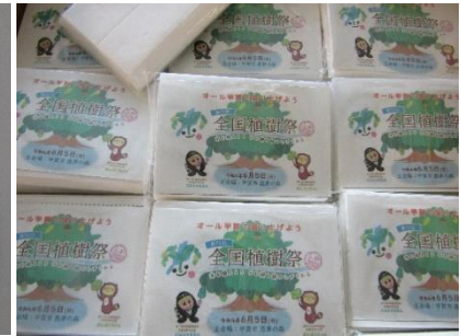
ポケットティッシュ

苗木のホームステイ【甲賀市版】参加者約 100 名に、育てている様子や苗木の育て方など、全国植樹祭の最新情報とともに情報提供