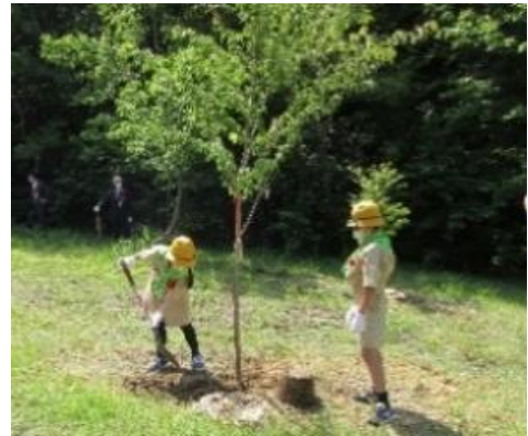
緑のしずく祭（植樹）