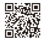
キャッシュレス 決済