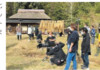
▲みなくち子どもの森

当協議会は、こうしたロケ地をさらに活用した観光振興や地域活性化をめざし、オール甲賀でのロケーションを推進します。