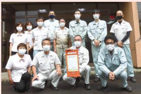
▲新光工業株式会社の皆さん

今後は、社員全員が、安心して働けるよう、さらに働きやすい環境を整えていきたいと考えています。