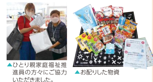
▲ひとり親家庭福祉推進員の方々にご協力いただきました。 ▲お配りした物資

ご寄付により子どもの食事や学びの機会を支援するため8月に甲賀市特産のお米や図書カードをお配りしました。 あわせて市からも物価高騰への支援としてレトルト食品などをお配りし、相談窓口などをご案内しました。 受け取られた方からは、「夏休みで子どもが家にいるので大変助かります。」とお礼の言葉をいただきました。