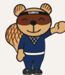
甲賀市図書館 キャラクター ため吉

このシリーズには、ほかに、滋賀県出身の木村敬一選手や、大橋悠依選手の物語が収録されています