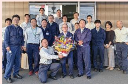
▲ポラテック西日本株式会社の皆さん

方に取り組み、労働時間の短縮を図りながら生産性の向上に取り組んでいきたいと考えています。