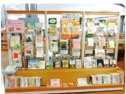
「図書館」の啓発コーナー