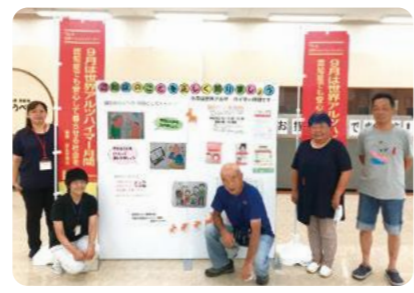
登録認知症サポーターの皆さん(ショッピングセンターの啓発コーナーで)

認知症啓発コーナーを設置します 認知症サポーター養成講座受講後、地域で活動している「登録認知症サポーター」が、啓発月間に合わせて、認知症啓発コーナーを市内各所に設置します。ぜひ、お越しください。