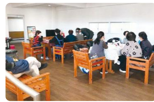
気軽に集える「オレンジカフェ」(しがらき)

認知症の方やその家族、地域住民等が気軽に集い、交流や情報交換、認知症の相談などができるという場です。9月は水口病院認知症疾患医療センター相談員、地域包括支援センター職員、認知症地域支援推進員が「物忘れ相談会」を次のとおり開催します。