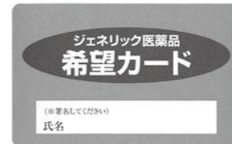
▲ジェネリック希望カード

ジェネリック医薬品への変更には不安がある場合、期間を設けて使用することもできますので、かかりつけの医師・薬剤師にご相談ください。