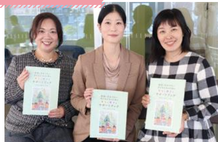
▲作成メンバーの皆さん