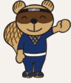
甲賀市図書館 キャラクター たぬ吉

甲賀市は東海道沿いの数か所が紹介されており、百年以上前に明治天皇が来られたときの人々の思いを今もその地にとどめています。ぜひ訪れてみてください。