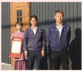
▲平木木材工業(株)の皆さん

弊社は、創業160年の歴史と実績で培った洗練された技とこだわりの素材を使用した木造住宅の建築工事を行っています。 100年後も愛される家づくりと企業の存続をめざし、社員が働きやすい職場環境を整え、自らも仕事と私生活を充実させたいという思いから、イクボス宣言をしました。 宣言後は、仕事の効率化、生産性の向上を図るため、クラウド管理システムを導入し、社員の業務負担の軽減につなげることができました。 また、4週8休制度を取り入れ、社員の家庭生活の充実と、子育てや地域活動、ボランティアへの積極的な参加を応援しています。 家づくりでは、お客様の想いを汲み取ることを一番大切に、無添加の材料や漆喰等を使用し、健康によい住宅を提供しています。 今後も、お客様に喜ばれる企業をめざすとともに、社員が結婚、子育て、介護などのそれぞれのライフステージにおいて、仕事と家庭の両立が実現できる職場づくりに全力で取り組んでいきたいと考えています。