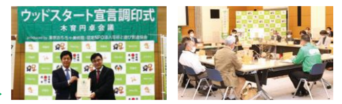
木育円卓会議の様子▶