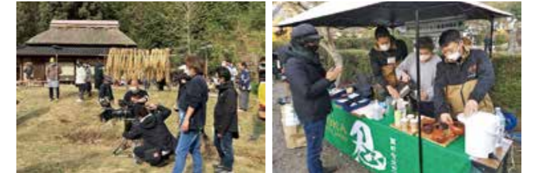
▲みなくち子どもの森でのロケ風景 ▲ロケ隊への地場産品PR

甲賀ロケーション推進協議会では市内でのロケ支援を行い、映画やドラマ等の誘致を進めています。ロケの際には土山茶やお菓子など、市の地場産品のPRも行っています。