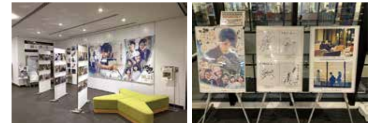
▲市役所でのパネル展(令和4年11月30日で終了) ▲現在は4階観光企画推進課前で一部展示中

昨年の、映画『線は、僕を描く』の公開に合わせ、市役所でパネル展を実施しました。この作品では「甲賀市役所」がロケ地となったほか、一般非公開場所ではありますが、「甲賀看護専門学校」「油日神社」「栄鶏園」など市内6か所がロケ地となりました。