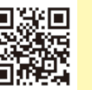
▲協議会ホームページ

市内でドラマの撮影が決定しているものや、ロケ地を探している作品もあります。今後、協議会HPからエキストラ登録やロケ地募集なども行いますのでご興味のある方はぜひお問い合わせください。映像やロケ地を活用して、市民の皆さんと一緒に、甲賀市を盛り上げていきたいと思ひます。ご協力をお願いします。