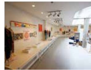
▲「スカーレット」で使用された衣装やロケセットを展示(旧信楽伝統産業会館:信楽町長野1142番地)

「スカーレット」で甲賀を盛り上げる推進協議会から事業継承し、旧信楽伝統産業会館では、引き続き「テレビドラマの世界」展を開催しています。