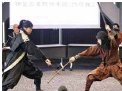
▲披露された伊賀市観光大使による伊賀忍者特殊軍団阿修羅のパフォーマンス