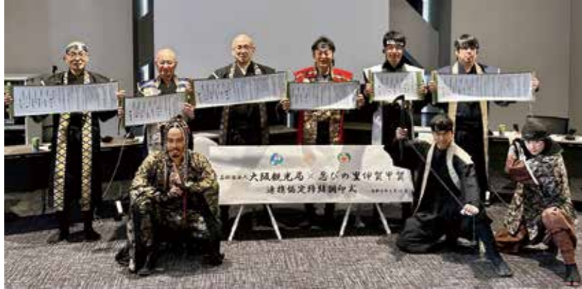
▲披露された協定書(「忍者の日」の午後2時22分22秒)