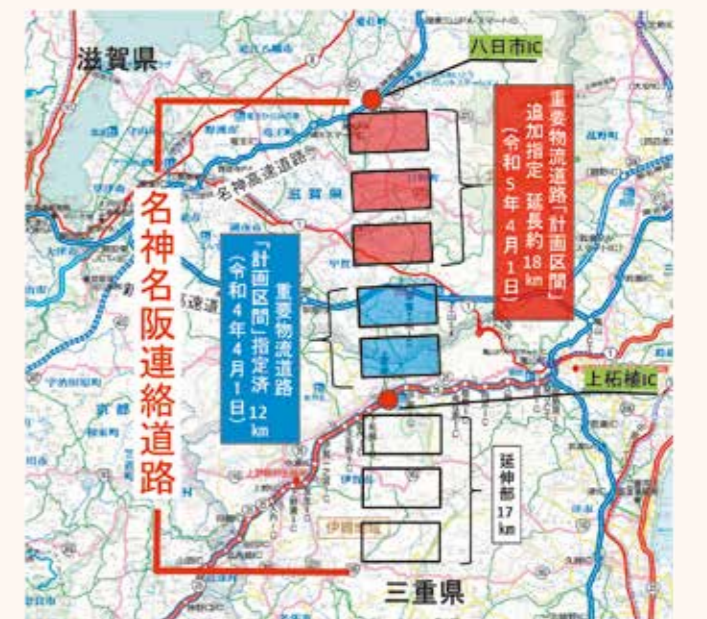
名神名阪連絡道路 重要物流道路追加指定 概略図

現在、本道路の計画を具体化していくため、滋賀県と三重県が調査を行っており、道路の構造やルートなどを決定していく重要な時期を迎えています。