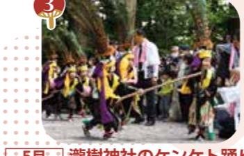
3 5月 瀧樹神社のケンセツ踊り (国指定無形民俗文化財 ユネスコ無形文化遺産)