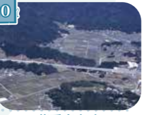
20 紫香楽宮跡 (国指定史跡)