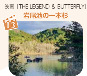
映画「THE LEGEND & BUTTERFLY」 岩尾池の一本杉