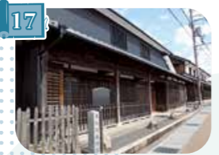
17 土山宿本陣跡 (国登録有形文化財)