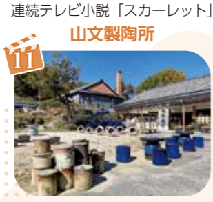
連続テレビ小説「スカーレット」 山文製陶所