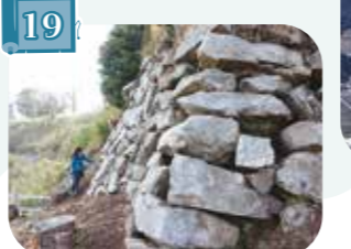
19 水口岡山城跡 (国指定史跡)