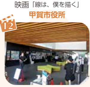
映画「線は、僕を描く」 甲賀市役所