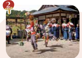
2 4月 黒川の花笠太鼓踊り (県指定無形民俗文化財)