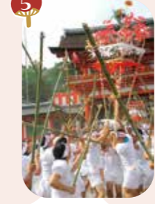
5 7月 大原祇園 (県指定無形民俗文化財)