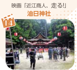
映画「近江商人、走る!」 油日神社