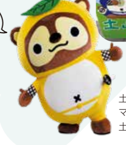
土山SA マスコットキャラクター 土山たぬき