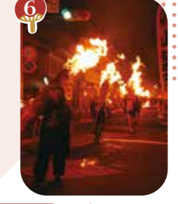
6 7月 しがらき火まつり