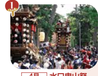
1 4月 水口曳山祭 (県指定無形民俗文化財)