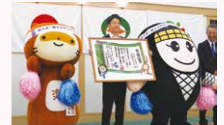
▲任命を受けるにんじゃえもん(右)と ぽんぽこちゃん(左)