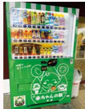
◀おむつの自動販売機