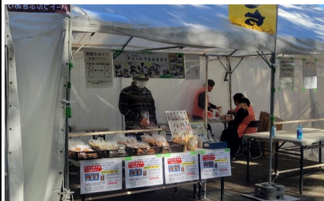
売店(障スポ 福祉作業所出店)