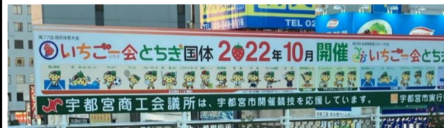
市内装飾(宇都宮駅ロータリー)