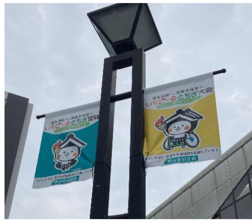
市内装飾(栃木市内)