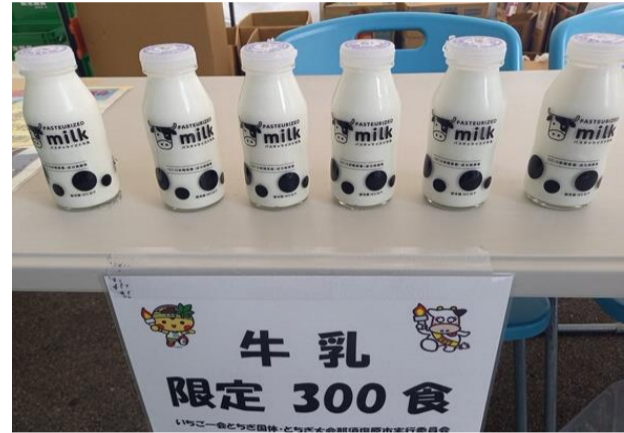
ふるまい(地域特産品のふるまい)