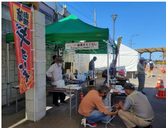
ふるまい(地元自治会によるふるまい)