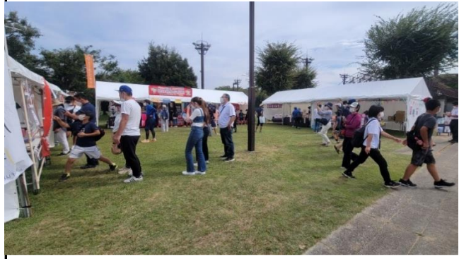
売店(地域の店舗の出店)