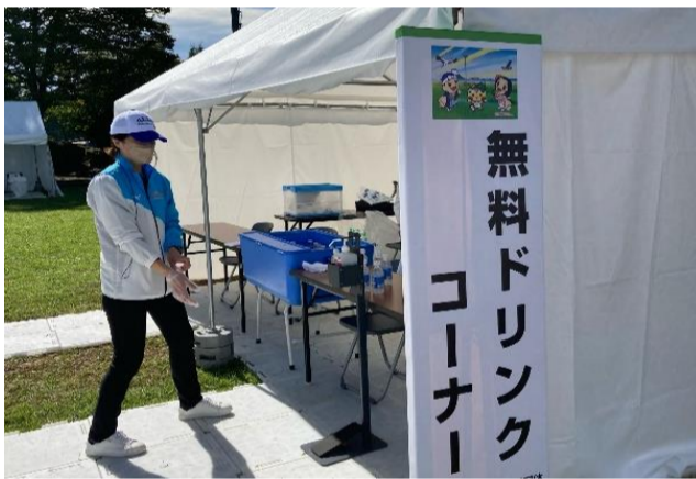
無料ドリンクコーナー