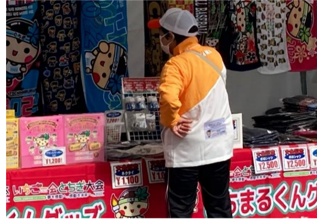
売店(大会グッズ販売)