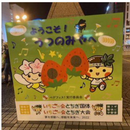
関連イベント(ジャズのまち宇都宮 ジャズフェス)