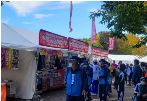
売店(障スポ 大会グッズ販売)