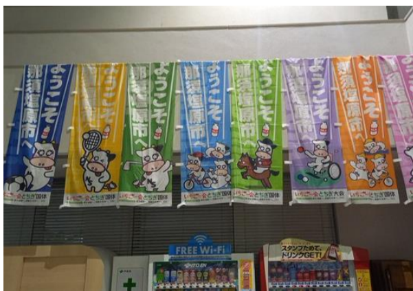
市内装飾(那須塩原市役所西那須野支所)