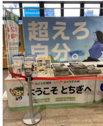
総合案内所(宇都宮駅総合案内所)