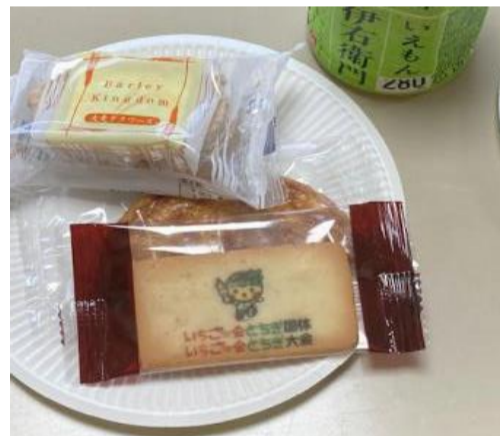
ふるまい(来賓へ地域のお菓子の提供)