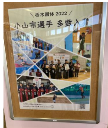
市内装飾(小山駅連絡通路)