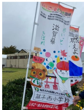
会場内応援装飾(都道府県応援のぼり旗)