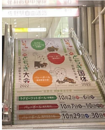
市内装飾(佐野駅階段)