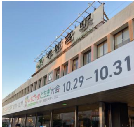
市内装飾(宇都宮駅)