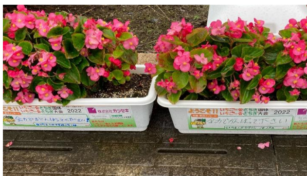
会場内応援装飾(花いっぱい運動)