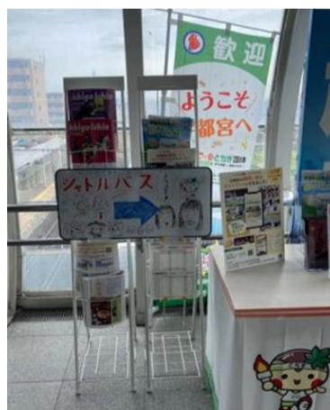
総合案内所(宇都宮市内 会場最寄駅)