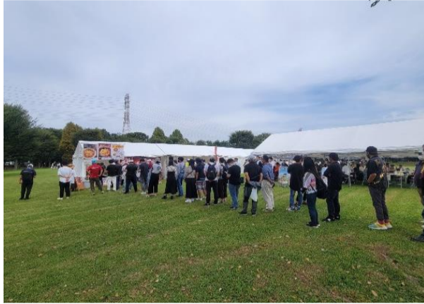
売店(地域の飲食店の出店)