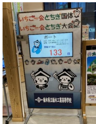
カウントダウンボード(栃木市観光案内所内)