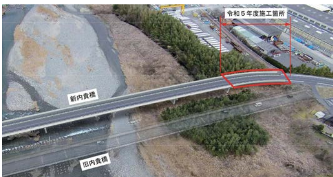
内貴橋完成イメージ