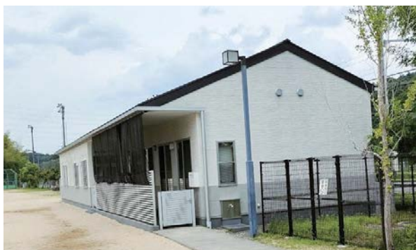
施設の一例（伴谷児童クラブ）