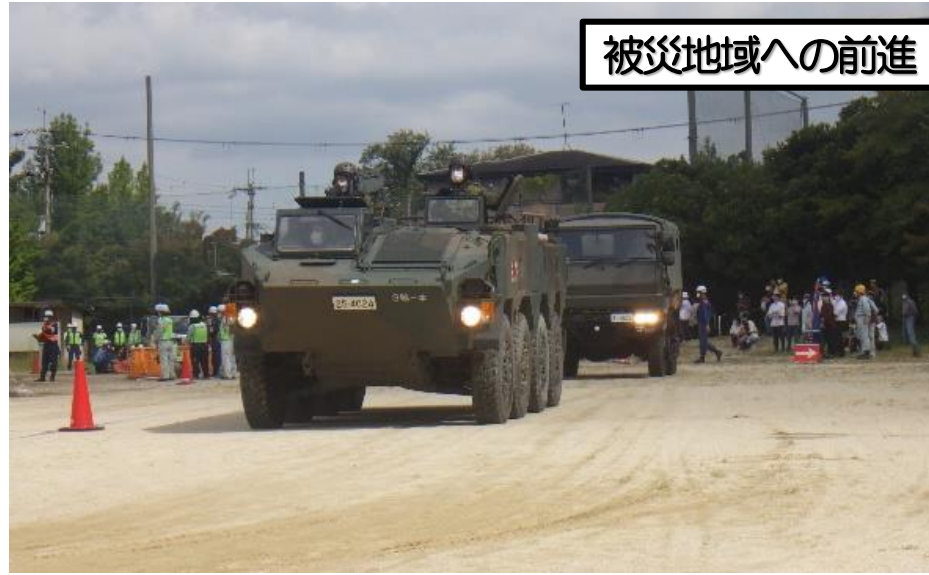
被災地域への前進