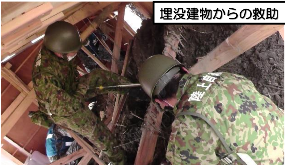
埋没建物からの救助