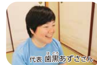
代表 黒黒あずささん

信楽地域は「大丈夫をみつけよう」というグループの中に令和3年4月からフードバンク機能を設けています。