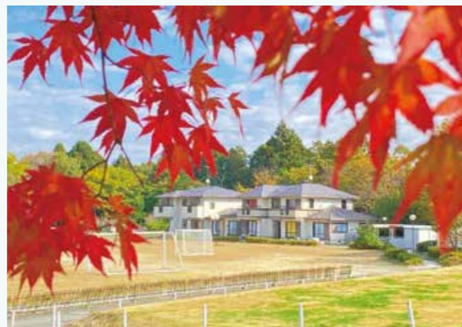
▲子どもたちが生活する鹿深の家

この度、老朽化した施設の建て替えを行います。子どもたちが日常生活を送るために必要な家具や家電などを購入するため、 11月からクラウドファンディング（寄付）を募ることになりました。 ご協力をお願いします。