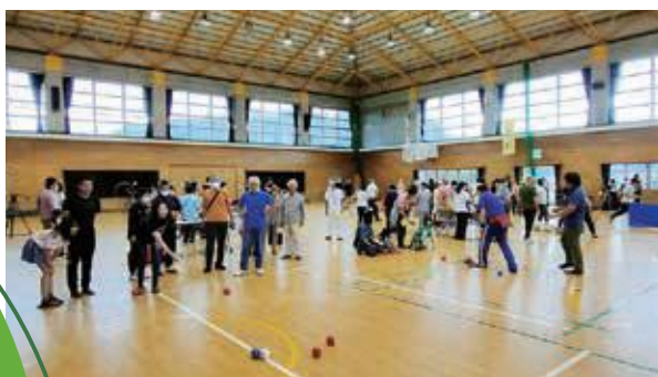
伴谷自治振興会主催のスポーツ大会

「自治振興会」から「まちづくり協議会」への名称変更については、強制ではなく選択制とし、現場の意見を聞きながら協議体であることを説明していくこと、地域マネージャーについては、マニュアルを作成し、研修等を実施し、市としてサポートをしていくこと、タウンミーティングや出前講座等を活用し市民へ周知していくことなどを確認しました。