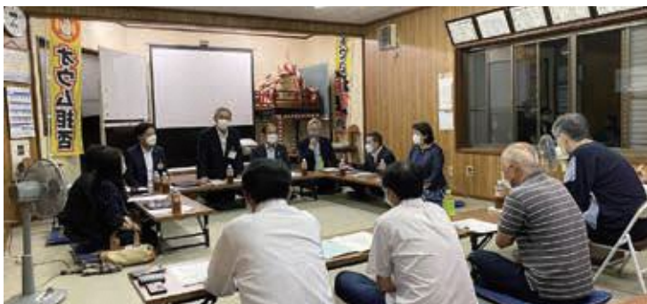
柏貴区意見交換会

市議会として、オウム真理教に対して、引き続き公安調査庁に観察処分を求める意見書について、9月定例会に提出することを全会一致で可決しました。