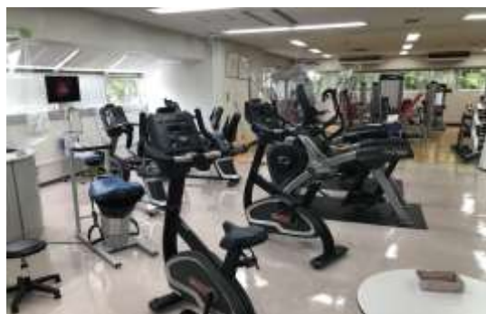
2階トレーニングルーム