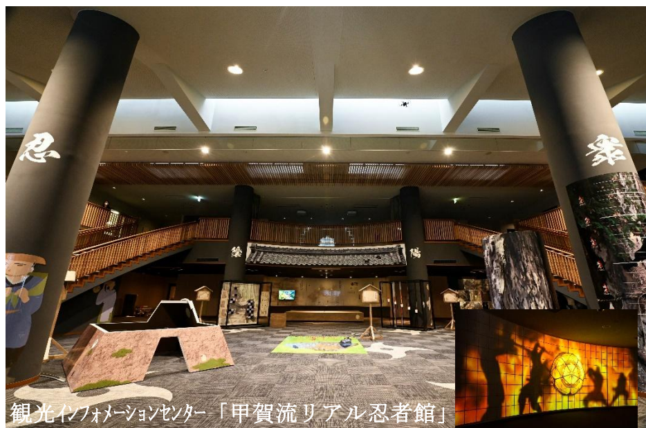
観光インフォメーションセンター「甲賀流リアル忍者館」

対象期間 令和8年4月 1日(水)～令和8年6月30日(火) 実施分 募集期間 令和8年2月 3日(火)～令和8年2月27日(金) 必着