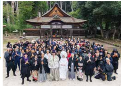
▲大勢の忍者が集まる「甲賀流忍者結婚式」

忍者たちが戦の作戦などを話し合う寄り場として使用されていたと言われる忍者ゆかりの地です。