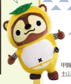
甲賀流忍者 土山たぬき