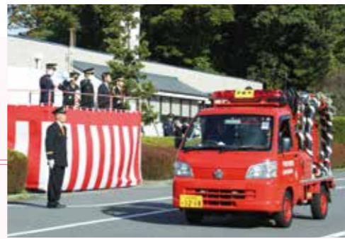
▲車両パレードの様子

市内の小学6年生を対象に募集した「夏休み子ども防火せんりゅう」の表彰式が併せて行われ、応募664点の中から優秀作品に選ばれた3人の児童に表彰状と記念品が贈られました。