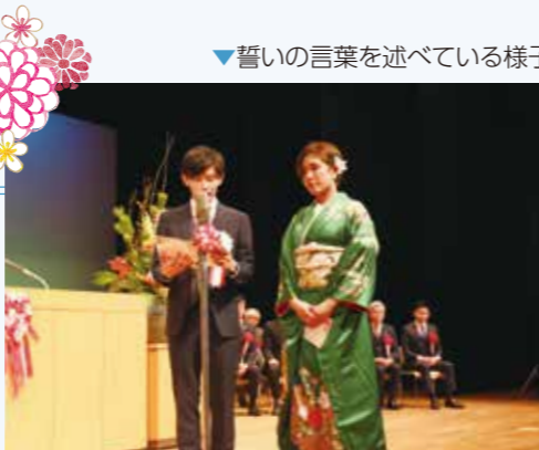
▼誓いの言葉を述べている様子