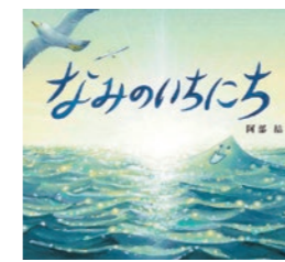
▲題材とした絵本 「なみのいちにち」 阿部 結作/ほるぶ出版

ぼくは、「なみのいちにち」を読んで「なみって、うみって、たのしいな」と思いました。同じなみでも、1日でやさしいときと怒っているときがあるからです。ぼくは、「なみが楽しいとき」を想像して、色とりどりの魚をたくさん描きました。絵は、担任の先生と相談をしながら図工の授業で5時間ぐらいかけて描きました。