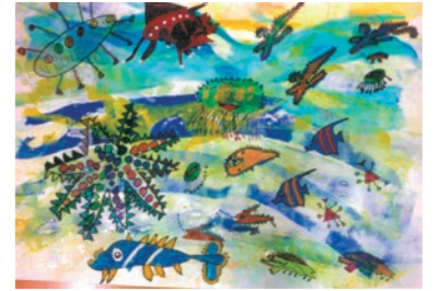
作品名「なみの上であそぶ魚たち」

※公益社団法人全国学校図書館協議会、毎日新聞社、実施都道府県学校図書館協議会主催