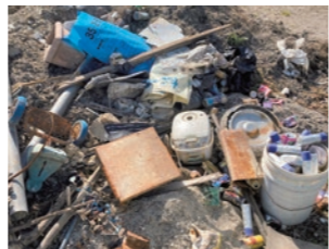
▲水路に投棄された粗大ゴミ等

水路付近は大変危険が伴います。特に台風時や急な大雨が降った時には増水の危険もありますので、水路には近づかないようお願いします。