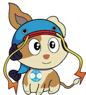
▲行政相談マスコット 滋賀ご当地キーン (愛称:びわんこ)