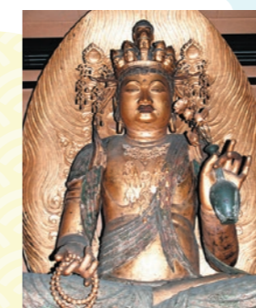
木造十一面観音坐像

坐像」は、「いちいの観音さん」の愛称で古くから地元に親しまれています。その美しい姿は、多くの人を惹きつける魅力があります。