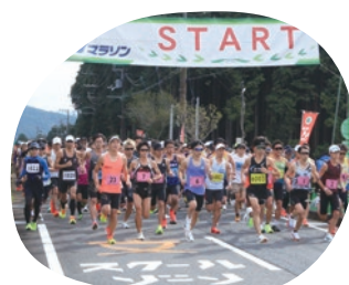
▲一斉にスタートするランナー

ランナーたちは、土山の豊かな自然と起伏を生かした全国屈指のマラソンコースを力強く駆け抜けました。