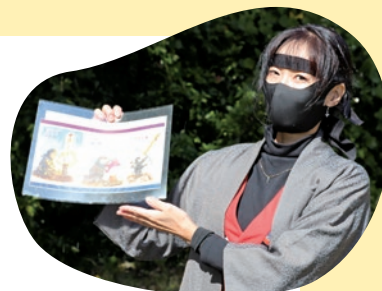
▲忍者のくすり売り体験の中でクイズを出題する忍者

さまざまなワークショップや体験を通して、香りと味覚でハーブに親しむ一日となりました。