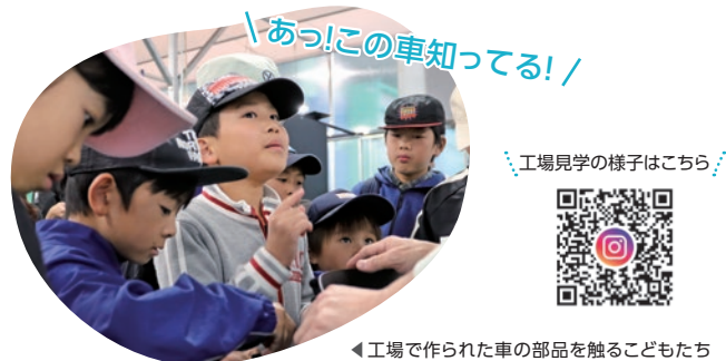
▲工場で作られた車の部品を触る子どもたち

昨年の3倍となる370人以上が参加しました。工場見学や体験を通して、ものづくりへの関心を高める貴重な機会となりました。