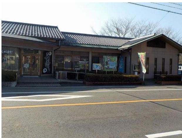
甲賀市甲賀もちふる里館全景