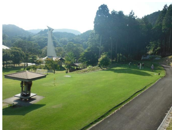
施設全景②（グラウンドゴルフ場）