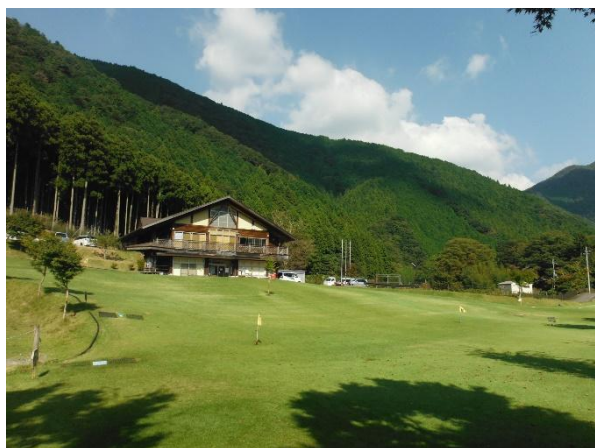
施設全景③（グラウンドゴルフ場）