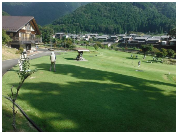
施設全景①（グラウンドゴルフ場）