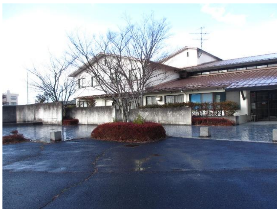
甲賀農村環境改善センター全景