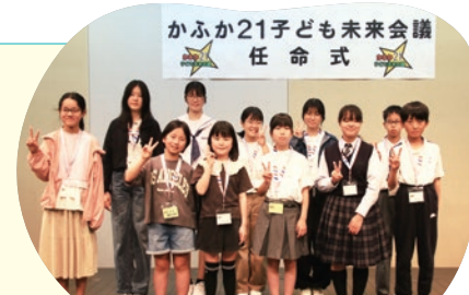
市内の小学5年生～中学3年生が参加!

これからの21世紀を担う子どもたちが、視察やワークショップを通じて地域のことを学びながら、地域活動や青少年活動に積極的に参加し、「住みよさと活気あふれる甲賀市」をみんなでつくることをめざしています。