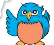
かふか21子ども未来会議 マスコットキャラクター カワビー

●問合せ：社会教育スポーツ課 青少年育成係 Tel 69-2248 Fax 69-2293