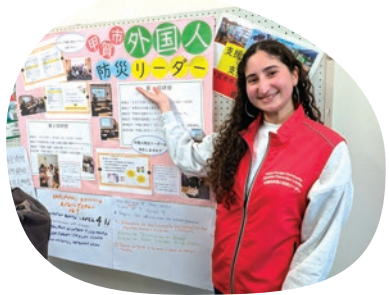
外国人防災リーダーによる展示の様子