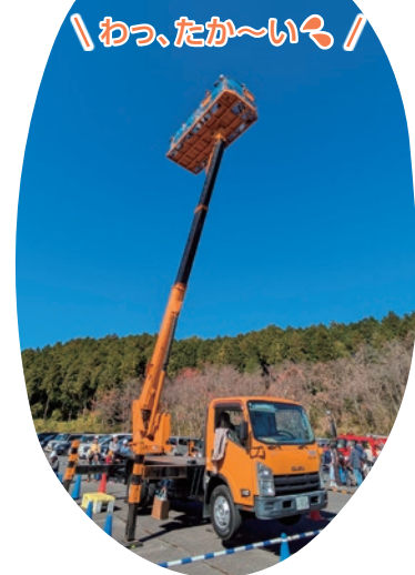
高所作業車に乗る参加者の様子