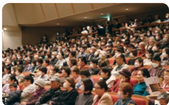
立ち見が出るほど大盛況だった「うみが通り過ぎたあとに」の上映会

映像祭で上映された作品「甲賀市忍者末裔課」が、4月20日時点で17万回以上再生中!皆さんもぜひチェックしてみてください。