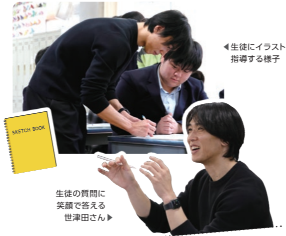
生徒にイラスト指導の様子

はじめは遠慮がちだった生徒たちも、次第に積極的に手を挙げ、熱心に耳を傾ける姿が見られました。