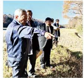
圃場現地での視察

A 中山間地域における厳しい耕作条件や、水利施設の老朽化に伴う維持管理の負担など、地域農業が直面する課題を改めて現場で学び、担い手の減少が進む中で耕作を継続することの難しさを改めて強く認識した。