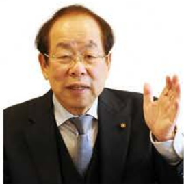
甲賀市議員団 日本共産党

A ①長野からの搬入はない。②現地での焼却以外の方法について提案し、早期の解決を図っていきたい。