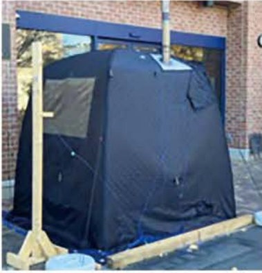
テント型サウナ(消防庁資料より引用)