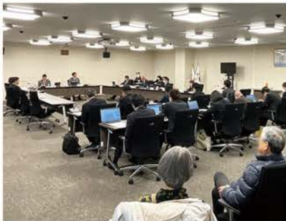
参考人招致の様子

プラスチックに係る資源循環の促進等に関する法律により、自治体は再商品化の努力義務が課されました。本市は、再商品化計画を作成し、国の認定を受け、水口テクノスとエコパレット滋賀との連携により再商品化までの処理がされます。