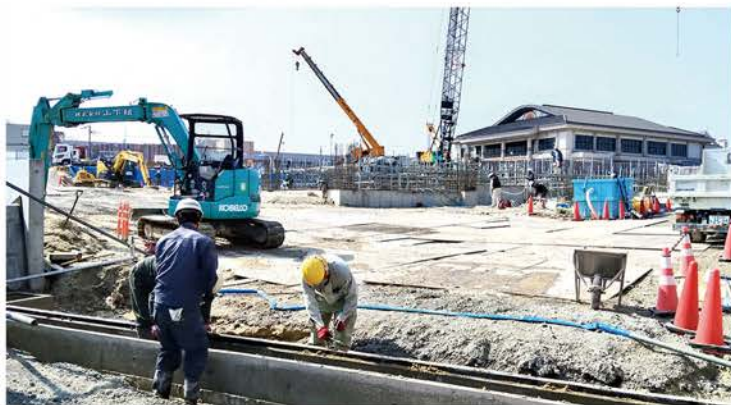
改築工事が進む信楽小学校

学校再編問題については委員会内でも議論を重ね、様々な視点で丁寧に取り組んでいかねばならないと考えています。