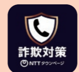
詐欺対策 byNTTタウンページ

詐欺の電話を直接受けたくないためには、国際電話番号などをアプリでブロックする対策が有効です。警察庁推奨アプリを活用して、無用な電話をブロックしましょう!