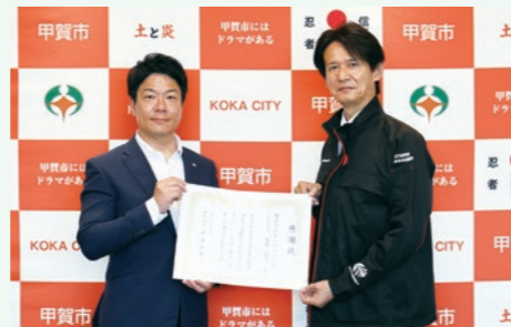
感謝状贈呈式の様子▶

オートバックス・甲賀店(株式会社オート・ハンズ)様から100万円をご寄附いただき、5月7日に感謝状を贈呈しました。いただいたご寄附は、ごみの出し方や公共交通機関の利用方法などの生活オリエンテーションや日本語教室の充実など、多文化共生の推進のために大切に使用させていただきます。