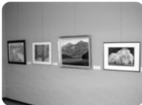
▲久米氏が描かれた風景画が展示されました。