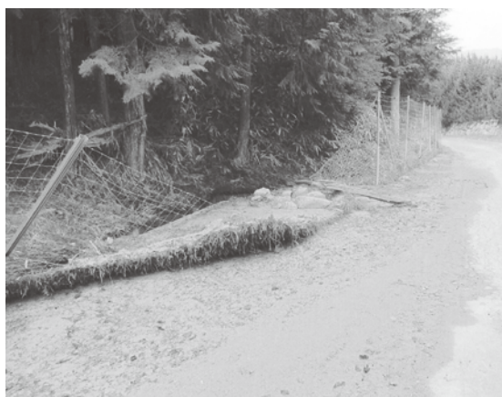
昨年の台風による被害直後

による防護柵の被害についても、各地域では復旧作業が行われています。集落環境の点検を行い、獣を寄せ付けないようにしましょう。