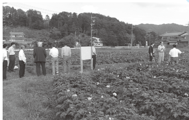
(農)黄瀬営農組合の食育畑の視察

今回で3回目となる甲賀・伊賀の両市の農業委員会役員による交流会が平成26年6月6日に甲賀市で開催されました。