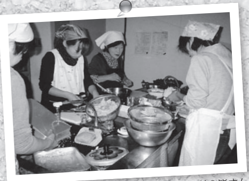
▲調理をする参加者の皆さん