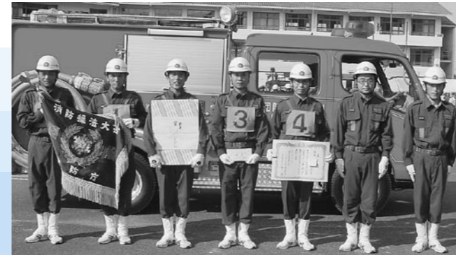
甲南方面隊第3・4分団 (ポンプ自動車の部)

8月6日(日)に滋賀県消防学校で開催された第41回滋賀県消防操法訓練大会で、本市から水口・甲南・信楽の3方面隊の皆さんが出場され、小型動力ポンプの部では、信楽方面隊朝宮分団が優勝、水口方面隊第4分団が4位入賞。ポンプ自動車の部では、甲南方面隊第3・4分団が優勝されました。 小型動力ポンプの部で優勝された信楽方面隊朝宮分団は、10月19日に兵庫県で開催される全国大会に出場されます。