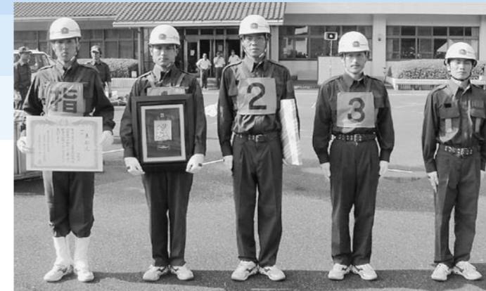
水口方面隊第4分団 (小型動力ポンプの部)