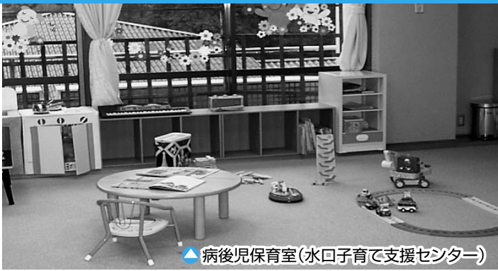
▲病後児保育室(水口子育て支援センター)