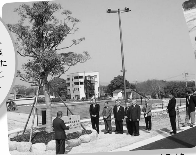
市民スタジアム横広場に植樹されたクスノキ

水口ライオンズクラブが「花と緑のふるさとづくり事業」の一環として、また結成40周年を記念して、甲賀市民スタジアムヘクスノキを、また大戸川堤防沿い(信楽地域)に桜など約500本を寄贈いただきました。早ければ2、3年後に、花をつけ始め、私たちの心をなごませてくれることでしょう。