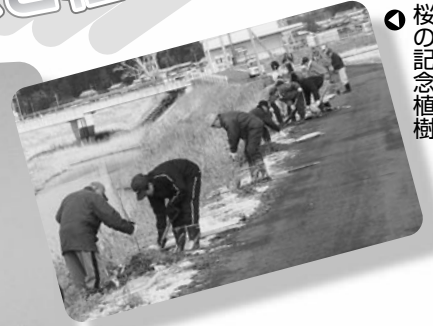
大戸川沿いに桜の記念植樹