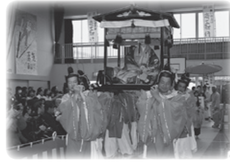
十二単姿で神輿に乗って登場する齋王