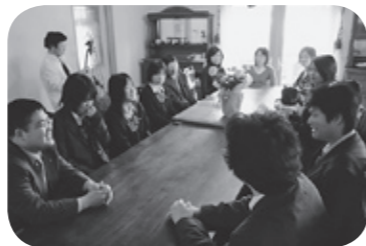
電車内でのマナーの現状について話し合う生徒とメンバー

JR草津線を利用する私たち全員が「周りの人へのほんの少しの思いやり」この言葉を胸に留め、これからも快適に利用したいものですね。