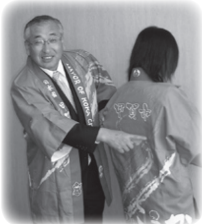
完成した法被のデザインを説明する中嶋市長

今後、市では各種イベントや行事、また観光キャンペーンなどあらゆる機会を通して、中嶋市長や市職員が着てセールスに歩き、元気ある甲賀市、魅力ある甲賀市をPRします。(事業費＝30万円)